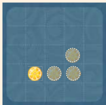
одне кружальце на три клітинки