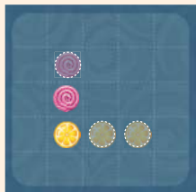
одне кружальце – на дві клітинки, друге – на одну клітинку