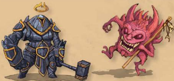
КОРОЛІВСТВО ГРАВЦЯ А

Виняток: ви не можете обрати формат "битва" для соло-режиму.