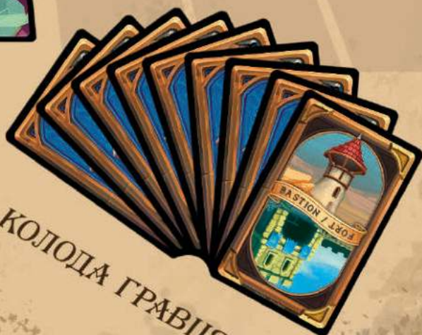
КОЛОДА ГРАВЦЯ Б