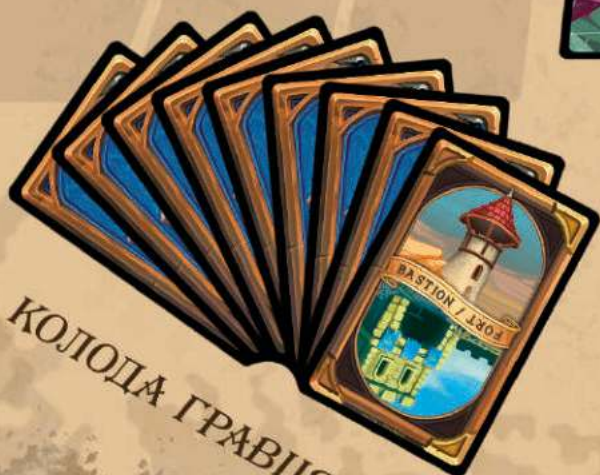
КОЛОДА ГРАВЦЯ А