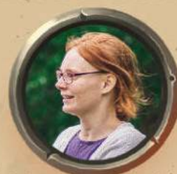
АДЕЛІН ДЕЛЕ ВИДАВНИЦТВО І ЛОГІСТИКА