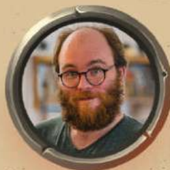
ЛЕАНДР ПРУСТ ГЕЙМДИЗАЙН І ВИДАВНИЦТВО