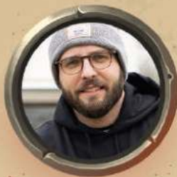
КЛЕМЕНТ ПРУСТ ГРАФІЧНИЙ ДИЗАЙН