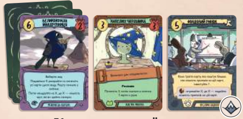
51 карта основної колоди 27 карт мешканців (по 9 ворон, жаб і кроликів) 12 карт манаток (по 4 воронячих, жаб'ячих і кролячих) 12 карт будівель (по 4 воронячих, жаб'ячих і кролячих)