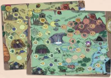
Двобічне ігрове поле (осінній та весняний доки)