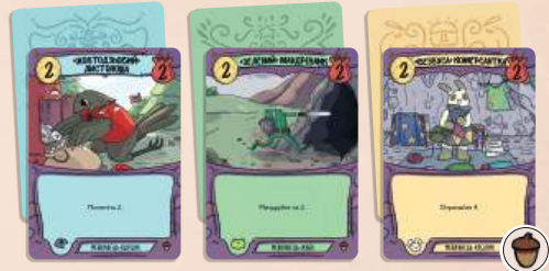
3 початкових карти мешканця (1 ворона, 1 жаба, 1 кролик)