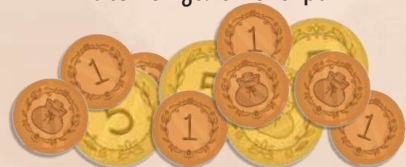
48 жетонів монет / припасів зі значенням 1 12 жетонів монет / припасів зі значенням 5 3