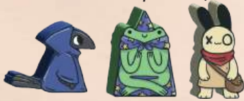
3 мандрівники (по 1 вороні, жабі й кролику)