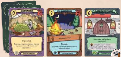
24 карти колоди академії 15 карт мешканців (по 5 ворон, жаб і кроликів) 6 карт манаток (по 2 воронячих, жаб'ячих, кролячих) 3 карти будівель (по 1 воронячій, жаб'ячій і кролячій)