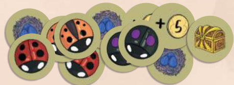
12 жетонів ігрового поля 6 жетонів зачарування (три сумісні пари), 3 жетони гнізда, 2 жетони «+5», 1 жетон золотої скрині