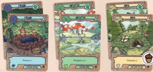
6 стартових карт (2 гнізда, 2 латаття, 2 нори)