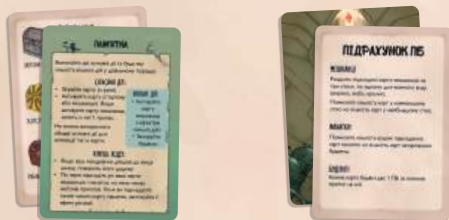
2 карти-пам'ятки 2 карти підрахунку ПБ