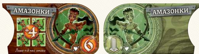
Амазонки: активні та занепалі