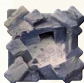
10 тролячих лігв