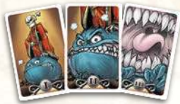
Карты Згубного Погляду із Зеленої Коробки

У грі також є карти, які використовує Темний Володар, щоби понижувати Посіпака Згубним Поглядом. У нижній частині карти Згубного Погляду вказана римська цифра, яка відповідає одному з трьох рівнів гніву Темного Володаря.