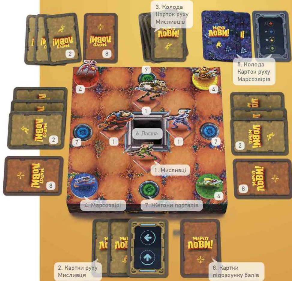
Малюнок 4. Ігрове поле з усіма ігровими елементами.