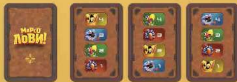
Картки підрахунку балів 4 шт.