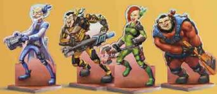
Мисливці 4 шт.