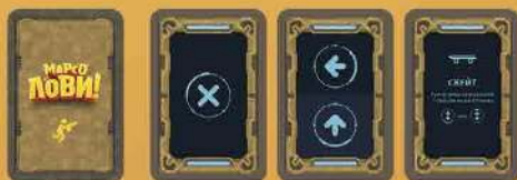
Картки руху Мисливців 50 шт.