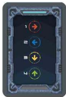
Малюнок 9. Картка руху Марсозвірів.

Положення колоди Карток руху Марсозвірів впродовж гри має залишатись незмінним.