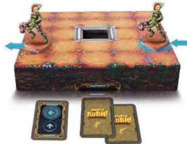
Малюнок 6. Переміщення Мисливця за межі ігрового поля.