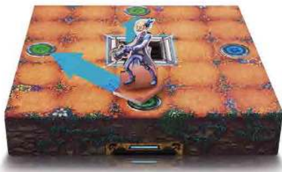
Малюнок 8. Переміщення Мисливця по жетонах порталів.

Якщо на ігровому полі є три Жетони порталу одного кольору, то Мисливець може вибрати будь-який з них для свого переміщення, мал. 8.