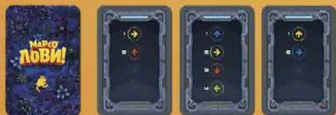
Картки руху Марсозвірів 16 шт.