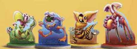
Марсозвірі 4 шт.