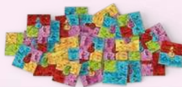
55 плиток Місцевості