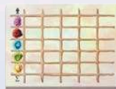
1 блокнот для підрахунку очок та олівець