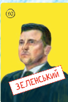
Зеленський (4 шт.)