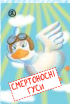
Смертносні гуси (4 шт.)