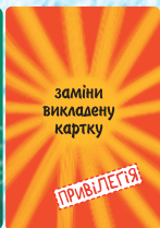
Привілеія (2 шт.)