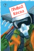
Привид Києва (4 шт.)