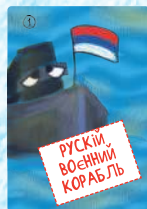
Руський воєнний корабль (4 шт.)

Комплект: 46 карток й у кожної власний номінал від 1 (найслабша) до 12 (найсильніша).