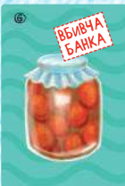
Вбивча банка (4 шт.)