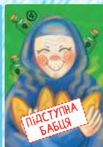
Підступна бабця (4 шт.)