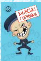
Київські гопники (4 шт.)