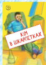
Кім в шкарпетках (4 шт.)