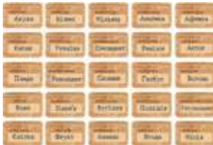
картки зі словами