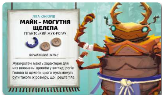
Карта борця: сторона Ліги Юніорів