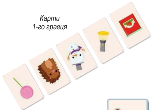
Карти 1-го гравця