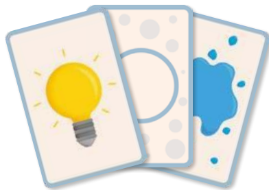
Сторона Ознаки (блакитна рамка)