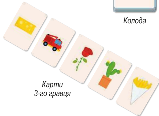
Карти 3-го гравця