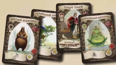
48 КАРТОК МОНСТРІВ