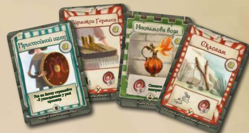
48 КАРТОК СПОРЯДЖЕННЯ