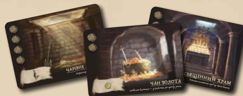
21 КАРТКА ПІДЗЕМЕЛЬ