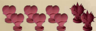
6 МАРКЕРІВ ЗДОРОВ'Я ГЕРОЇВ 2 МАРКЕРИ ЗДОРОВ'Я МОНСТРА