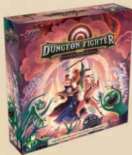
Зали мерзеної магми