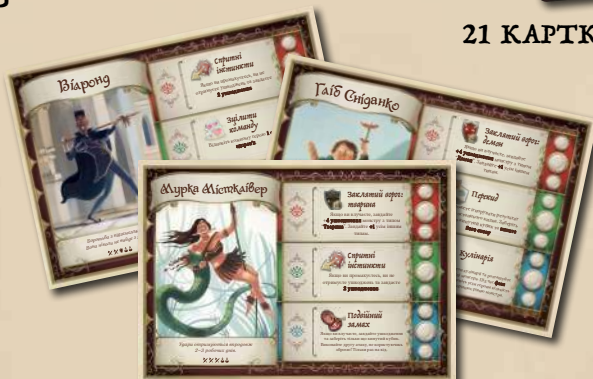
8 ПЛАНШЕТІВ ГЕРОЇВ