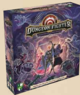
Катакомби похмурих привидів

ПОРИНЬТЕ У ФАНТАСТИЧНИЙ СВІТ ПРИГОД З НОВОЮ РОЛЬОВОЮ ГРОЮ У ВСЕСВІТІ ГРИ "ВОЇНИ ПІДЗЕМЕЛЬ":