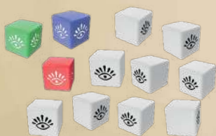
12 КУБИКІВ (3 КОЛЬОРОВИХ КУБИКИ ГЕРОЯ + 9 БЛИХ БОНУСНИХ КУБИКІВ)