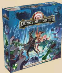
Замок моторошних морозів