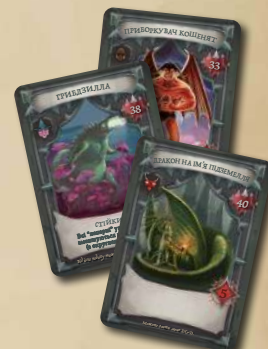
6 КАРТОК БОСІВ