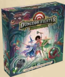
Лабіринт шалених штормів

Ці цікаві самотійні доповнення наразі не локалізовано українською, але... все може бути! НОВІ ГЕРОЇ, НОВІ МОНСТРИ, НОВІ ПІДЗЕМЕЛЛЯ, НОВІ КУБИКИ ТА КУПА НОВИХ ПРИСТРОЇВ ІЗ БОЖЕВІЛЬНИМИ СПОСОБАМИ ВЛУЧИТИ АБО ПРОМАХНУТИСЯ можуть стати вашими, якщо "Воїни підземель" зможуть стати достатньо популярними в Україні.