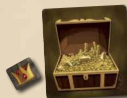
1 ЖЕТОН ЛІДЕРА 1 ПЛИТКА СКРИНІ