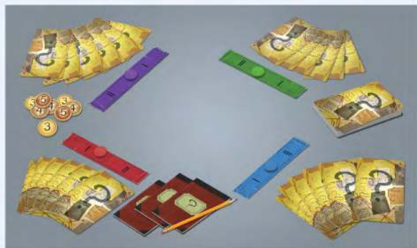
Підготовлені компоненти для 4 гравців.