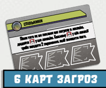
6 КАРТ ЗАГРОЗ