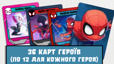
36 КАРТ ГЕРОЇВ (ПО 12 ДЛЯ КОЖНОГО ГЕРОЯ)