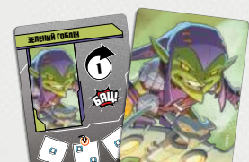
12 КАРТ ЗЛОВІСНОГО ЗАДУМУ