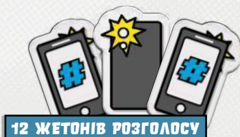
12 ЖЕТОНІВ РОЗГОЛОСУ