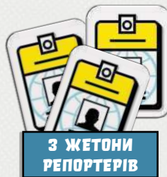
3 ЖЕТОНИ РЕПОРТЕРІВ