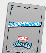
1 КАРТА ВИПРОБУВАННЯ