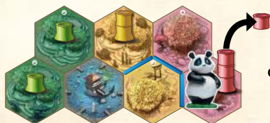
Панда з'їдає сегмент бамбука на ділянці, де завершує своє переміщення