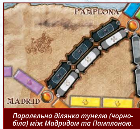
Паралельна ділянка тунелю (чорно-біла) між Мадридом та Памплоною.