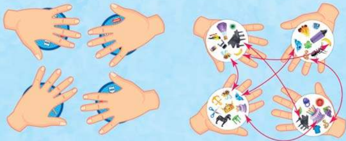
Приклад роздачі карточок на 4-х гравців

Підготовка до гри. Цей варіант гри проходить у декілька раундів. Після перетасовки колоди, гравці отримують по одній карточці. Решта карточок відкладаються в сторону до наступних раундів. Кожен учасник кладе свою карточку собі у долоню (див. мал.).