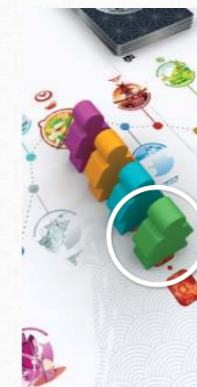
Зелений мандрівник першим покидатиме рьокан.

Мандрівник, який першим прибуває до рьокану, бере стільки карт страв, скільки є гравців, плюс 1. (Наприклад, у грі в трьох він бере 4 карти).