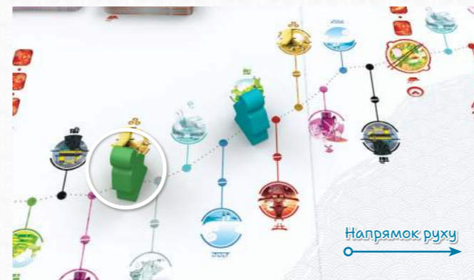
Зелений мандрівник — останній, тому хід переходить до нього.

Якщо після завершення ходу гравця його мандрівник залишається останнім, то він ходить ще раз.