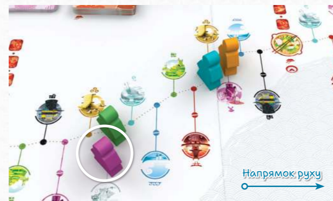
Фіолетовий мандрівник перебуває позаду зеленого мандрівника, тому хід переходить до нього.