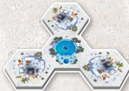
4 початкові плитки кварталів