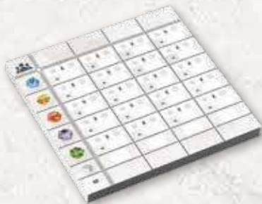
1 блокнот для підрахунку очок