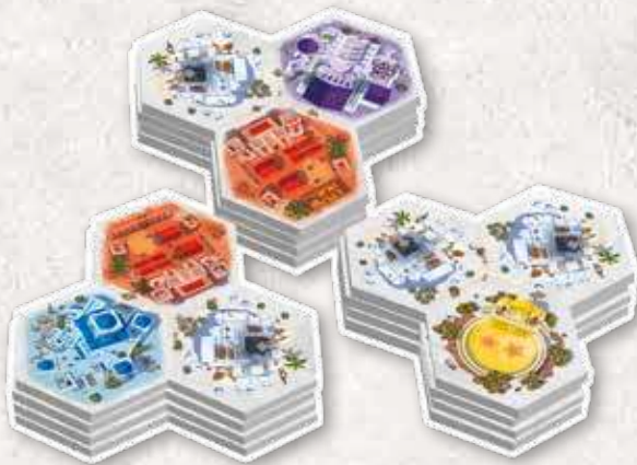
61 плитка кварталів