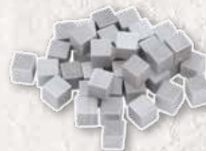
40 кубиків каменю