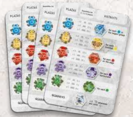
4 пам'ятки гравця