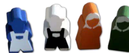
14 ФІГУРОК РОБІТНИКІВ