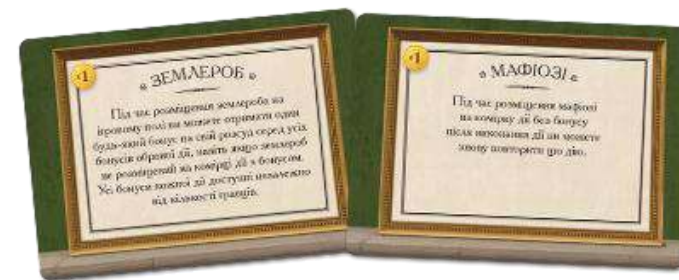
11 КАРТ СПЕЦІАЛЬНИХ РОБІТНИКІВ