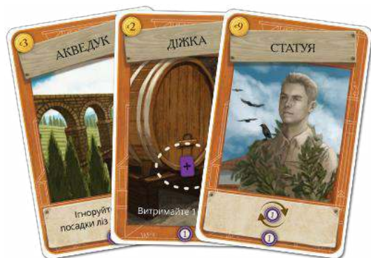
36 КАРТ СПОРУД