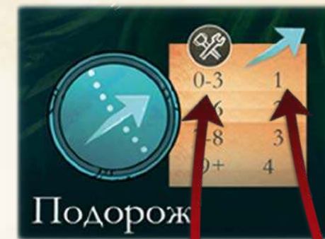
Очки долі Відстань, на яку можна подорожувати

Після того, як ви виконали дві дії, передайте жетон капітана гравцеві ліворуч. Цей гравець ходитиме наступним.