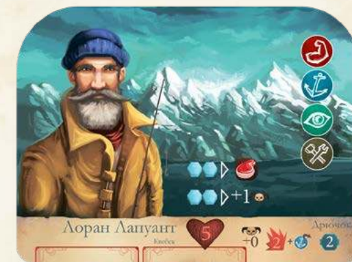
Вартість, вказана у жетонах команди

Ви у будь-який час можете спорядити одного з членів екіпажу картою здібностей, але не під час бою або випробування. Оберіть зі своєї руки картку здібностей, сплатіть до запасу вказану кількість жетонів команди та покладіть картку під нижній край планшета так, щоб було видно лише половину картки. Коли ви споряджаєте картою члена екіпажу, він отримує навичку та здібність, вказані на картці. У прикладі праворуч Лоран отримав 1 додаткову навичку сили. Тепер він також може використовувати здібність "Адреналін", коли це можливо.