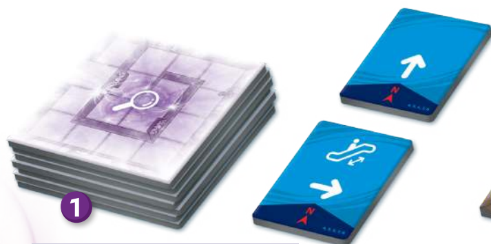
▲ Підготовка до гри для 4-х гравців.