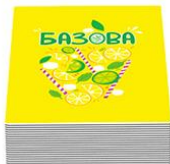
50 базових карт