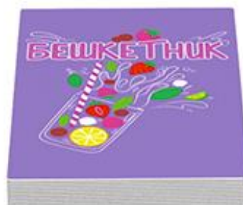
25 карт «Бешкетник»