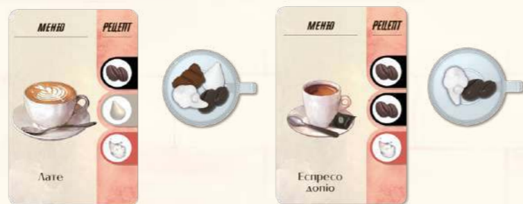
Приклад правильно виконаного замовлення