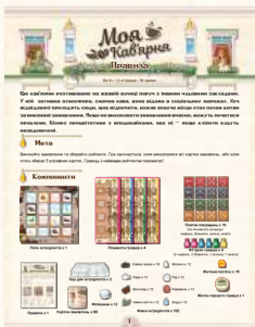
Правила x 1