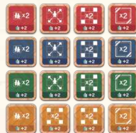
Плитки покращень x 16 (по 4 кожного кольору: червоні, блакитні, зелені, жовті)