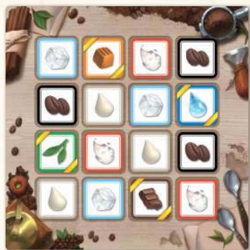
Поле інгредієнтів x 1