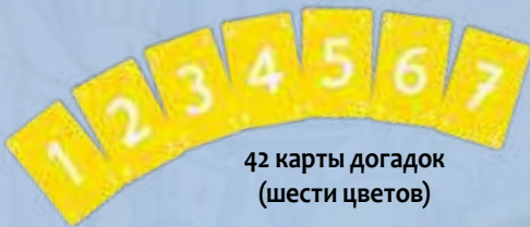
42 карты догадок (шести цветов)