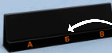
Подставка для карт

Наклейте наклейки так, как показано на рисунке