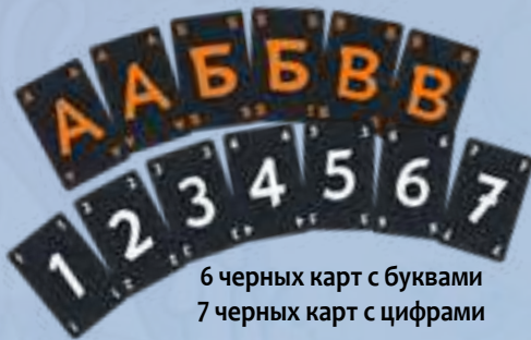
6 черных карт с буквами 7 черных карт с цифрами