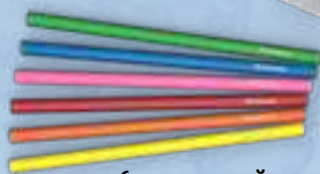
6 карандашей разных цветов