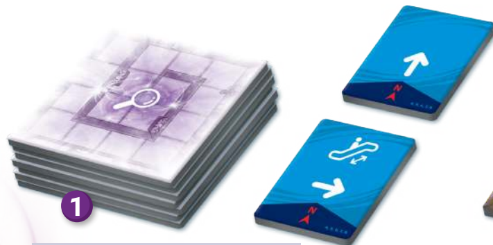
▲ Підготовка до гри для 4-х гравців.