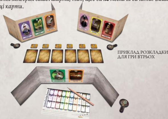
ПРИКЛАД РОЗКЛАДКИ ДЛЯ ГРИ ВТРОХ

Примітка: Тепер ви отримали набір карт від гравця праворуч (особу, місце, зброю), що розміщені у зовнішніх холдерах вашої ширми, так, щоб ви не могли їх бачити. Ваша мета визначити ці карти.