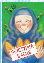
Підступна бабця (4 шт.)