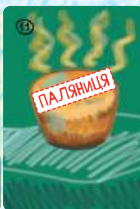
Паляниця (4 шт.)