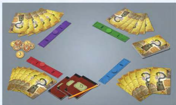
Підготовлені компоненти для 4 гравців.