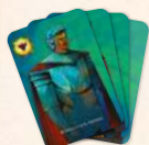
Вірний слуга Артура (4 карти)