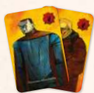
Посіпак Мордреда (2 карти)