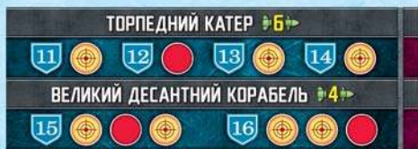
Торпедний катер № 12 та ВДК №16 гравця синього флоту знищений

Корабель вважається знищеним, якщо отримав максимальну кількість поранень. Після чого він виводиться з гри.