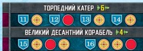
Гравець червоного флоту на своєму планшеті, також відмічає всі поранення супротивника

Переможцем стане той гравець, котрий першим знищить усі кораблі супротивника.