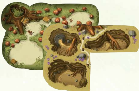
6 планшетів гравців