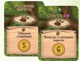
9 карт особливих подій