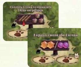
4 карти лісу