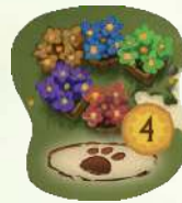
Тайл фестивалю квітів