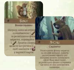
15 карт здібностей