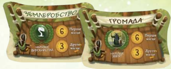
7 стрічок нагород