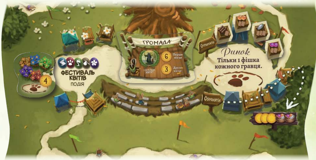
Приклад поля Дзвінограю з фестивалем квітів, стрічкою нагороди та ринком.

Поле Дзвінограю має ринок, а також місця для фестивалю квітів і стрічок нагород.