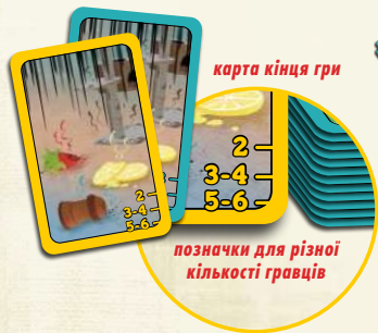
позначки для різної кількості гравців