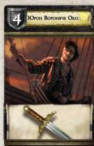
Карта Дому Грейджой

Учасники бою потайки одне від одного вибирають по одній карті Дому з руки. Коли обидва гравці виберуть карти, вони одночасно відкривають їх. Якщо карти мають особливі властивості, їх негайно застосовують.