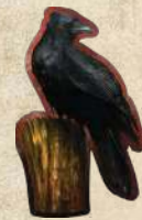
Жетон поштового ворона

↳ Замінити жетон наказу. Власник ворона може замінити невикористаним наказом один зі своїх раніше викладених наказів.