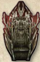
Жетон Залізного трону

Примітка. Залізний трон не переходить до іншого гравця, поки не завершиться боротьба за трек Залізного трону. Це означає, що гравець, який досі має жетон Залізного трону, розв'язує можливу нічию під час боротьби за трек Залізного трону, навіть якщо потім він утратить цей жетон.