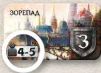
Використовують у грі вчотирьох або в'ятьох

Наприклад, у грі втрьох викладіть жетони нейтральних лордів з позначкою «3».