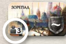
Використовують лише у грі втрьох

Усі жетони нейтральних лордів двосторонні. Одну сторону використовують лише в партіях утрьох, а іншу — у грі з більшою кількістю гравців. Розмістивши потрібні жетони нейтральних лордів, решту жетонів лордів покладіть у коробку.