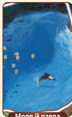
Моря й озера