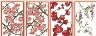
Спільні карти в центрі столу