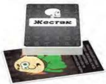
Жестяк Круті завдання для відпочинку, що зносять дах