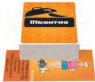
Пікантна Додасть легкі нотки вишуканості та еротики вечірці