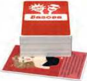
Базова Основна колода гри