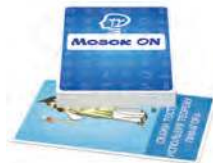
Мозок ON Завдання цієї колоди для тих, хто ще може щось второпати