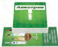
Алкотреш Завдання для алкопати із ацентом на "алко"