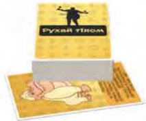
Рухай тілом Завдання цієї колоди змусять тебе підвестись з-за столу і як слід поворушити сідничками