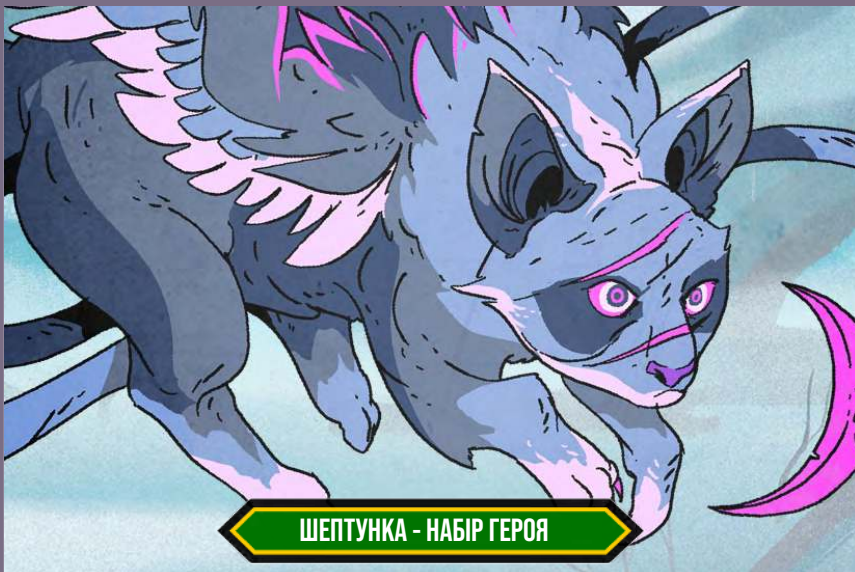
ШЕПТУНКА - НАБІР ГЕРОЯ

Перш ніж померти, Старий Вартовий створив Шептунку в серці Безлистоного лісу. За довгі роки боротьби з примарами вона розвинула свої вбивчі здібності. Шептунка здатна напасти так швидко, що жертва не встигне й оком змигнути.