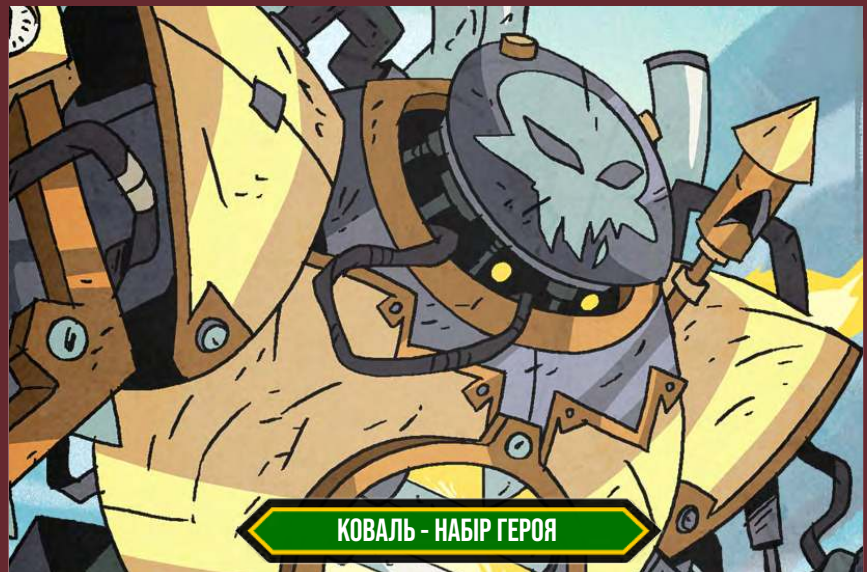
КОВАЛЬ - НАБІР ГЕРОЯ

Коваль — потужний робот, який має чудовий бойовий арсенал і готовий до будь-яких ситуацій. Мало хто може пробити його масивний щит, що подвоюється в розмірах і може зненацька вибухнути. Цей непереможний титан знає безліч способів знищення ворогів і йому ніколи не заважають емоції.