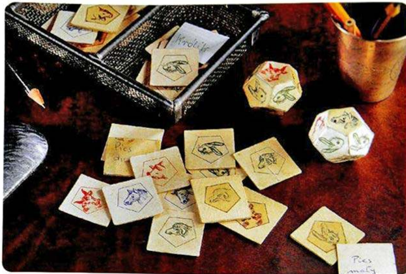
Оригінальна гра "Тваринна ферма" 1943 р.

Оригінальні примірники згоріли в пожежах міста під час Варшавського повстання в серпні 1944 року. На щастя, один примірник зберігся, і через багато років після війни повернувся до родини Борсуків. З нагоди 100-річчя з дня народження пані Зофії Борсук, 25-річчя від дня смерті професора Кароля Борсука та 10-річчя поновлення версії "Тваринної ферми" - "Супер фермер" розважає чергові покоління дітей та батьків. Ми даруємо Вам нову, яскраву, об'ємну, динамічну версію гри. Сподіваємося, що Вам сподобається.