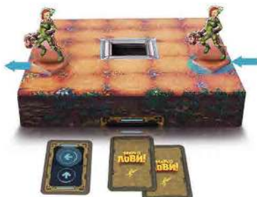
Малюнок 6. Переміщення Мисливця за межі ігрового поля.