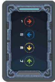
Малюнок 9. Картка руху Марсозвірів.

Положення колоди Карток руху Марсозвірів впродовж гри має залишатись незмінним.