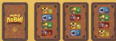
Картки підрахунку балів 4 шт.