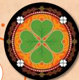
Диск останнього шансу