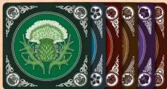
Планшети гравців (квітова сторона)