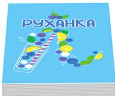
25 карт «Руханка»