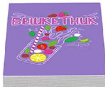
25 карт «Бешкетник»