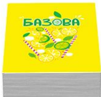
50 базових карт