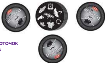
Приклад роздачі карточок на 3-х гравців

Підготовка до гри. Ретельно перетасуйте колоду карт. Роздайте кожному учаснику по одній карточці сорочкою вверх, решту – покладіть стопкою по центру столу у відкриту.