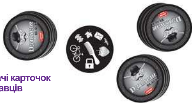
Приклад роздачі карточок на 3-х гравців

Підготовка до гри. Ретельно перетасуйте колоду карт. Почніть роздачу усіх карток між гравцями (по одній) сорочкою вгору, починаючи з найстаршого учасника. Останню карточку покладіть посеред столу у відкриту.