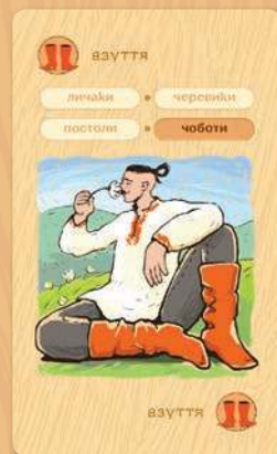
ЗІБРАННЯ (колекція) з 4 карток

ВАЖЛИВО! Серед карток ПРЕДМЕТІВ СПАДЩИНИ є 3 особливі картки, які не формуються у ЗІБРАННЯ (колекції). Це картки ХЛІБ, ПІВЕНЬ та ЗЛИДНІ. Вони мають особливі властивості, які ми розглянемо згодом.