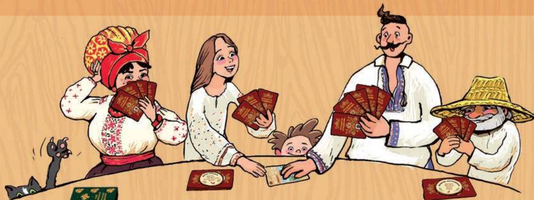
планшетка «ВСЬОМУ СВІЙ СТРИЙ» (кружальця ЗІБРАНЬ)

Гравці беруть свої картки й не показують їх іншим гравцям. Але самі можуть роздивлятися й зручно складати в руках. Тут є що порозглядати. Кожен з гравців отримав унікальні предмети матеріальної спадщини українців. Належать вони до різних ЗІБРАНЬ (колекцій). Розпізнати ЗІБРАННЯ (колекцію) допоможе його позначка в заголовку картки.