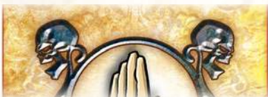
Карта Дії із Черепом Рігора Мортіса

Отримавши третій Згубний Погляд, ви маєте останню можливість врятуватися, благаючи про милосердя. Якщо Темний Володар вважає благання достатніми, ви можете взяти з колоди карту Дії. Якщо на карті не зображено череп Рігора Мортіса, то вас врятовано і ви можете продовжити гру, ніби й не отримували третього Згубного Погляду.