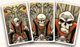
Карты Згубного Погляду із Червоної Коробки