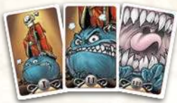
Карты Згубного Погляду із Зеленої Коробки

У грі також є карти, які використовує Темний Володар, щоби понижувати Посіпака Згубним Поглядом. У нижній частині карти Згубного Погляду вказана римська цифра, яка відповідає одному з трьох рівнів гніву Темного Володаря.