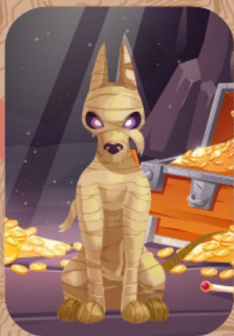
Привид з руїн

Порожня картка. Якщо гравець витягнув цю картку, наступний хід він грає із заплющеними очима. Наступний за годинниковою стрілкою гравець витягує картку пошуку артефакту, всі гравці шукають його. А гравець із заплющеними очима може випробувати інтуїцію та наосліп ляснути по одному з таборів. Якщо спроба вдала – гравець забирає шуканий артефакт та ще один будь-який біля цього ж табору. Якщо спроба невдала - гравець переміщує один свій артефакт до табору контрабандистів.