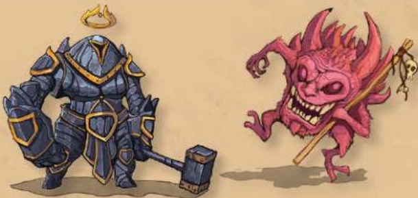
КОРОЛІВСТВО ГРАВЦЯ А

Виняток: ви не можете обрати формат "битва" для соло-режиму.