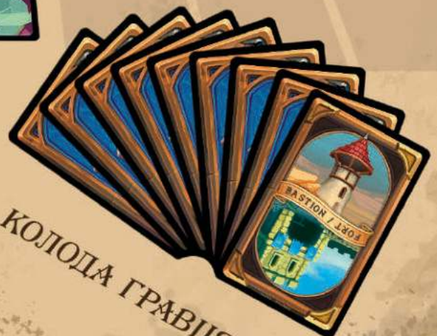
КОЛОДА ГРАВЦЯ Б