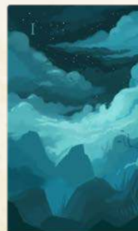
78 карток ворогів (розташовані у числовому порядку, не тасувати)