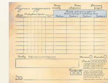
Аркуш журналу подорожей

Візьміть з блокноту новий аркуш журналу подорожей для вашої кампанії. Визначтеся, у якому режимі ви будете грати: звичайному чи жорстокому. Щоб дізнатися їхні відмінності, прочитайте відповідний розділ (див. "Поразка" на стор. 28 осн. правил). Якщо ви зазнаєте поразки в звичайному режимі, то зможете швидко розпочати нову гру і продовжити кампанію з того місця, де її закінчили. Жорстокий режим дає більше очок в кінці кампанії, але коли ви зазнаєте поразки, ви програєте кампанію і маєте почати нову. У верхній частині аркуша впишіть дату, а у нижній — імена всіх гравців.