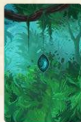
60 карток здібностей