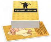
Рухай тілом Завдання цієї колоди змусять тебе підвестись з-за столу і як слід поворушити сідничками