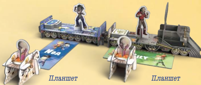
Планшет вертикально: складніша позиція

Перемістіть фігурку Сема. Подумайте, з якої позиції ви б хотіли стріляти (складнішої чи простішої) і скористайтеся своїм планшетом-пам'яткою, щоб розташувати Сема ближче до поїзда або далі від нього (див. малюнок нижче).